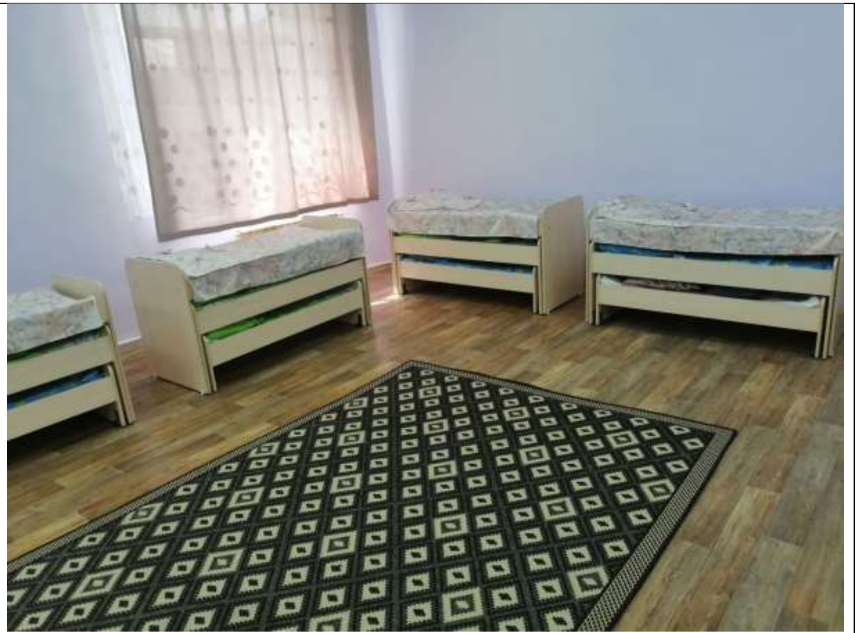
Фото 58 спальня группы №4 расстановка кроватей