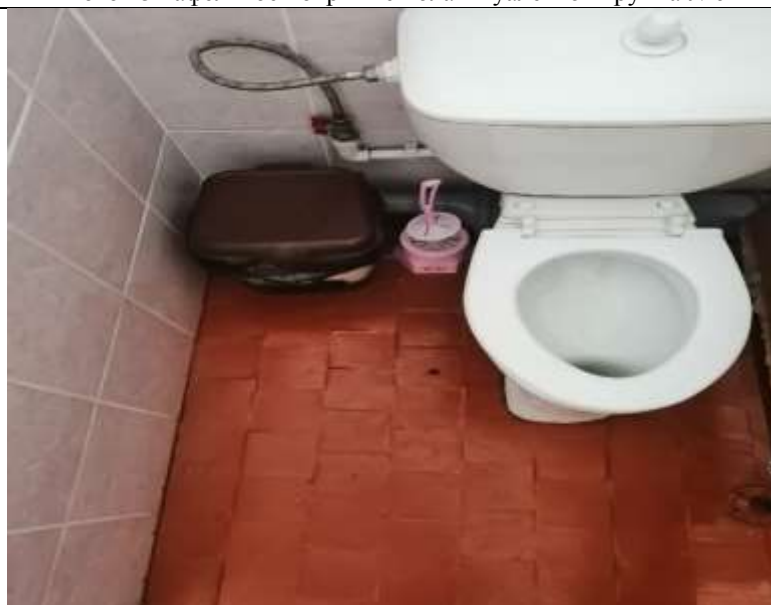
Фото 46 кафельное покрытие пола в туалетной группа №8