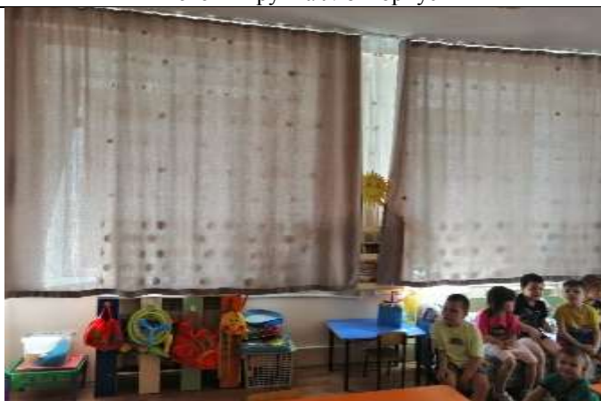
Фото 25 группа №9 корпус 3