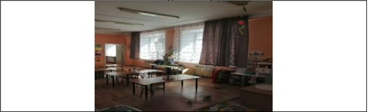
Фото 20 группа №4 корпус 2