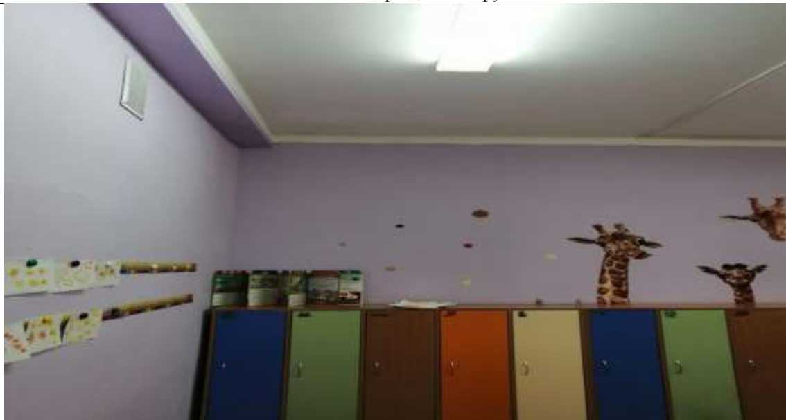
Фото 49 потолок в туалете группы №7