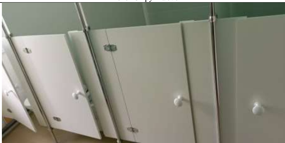
Фото 14 группа №10