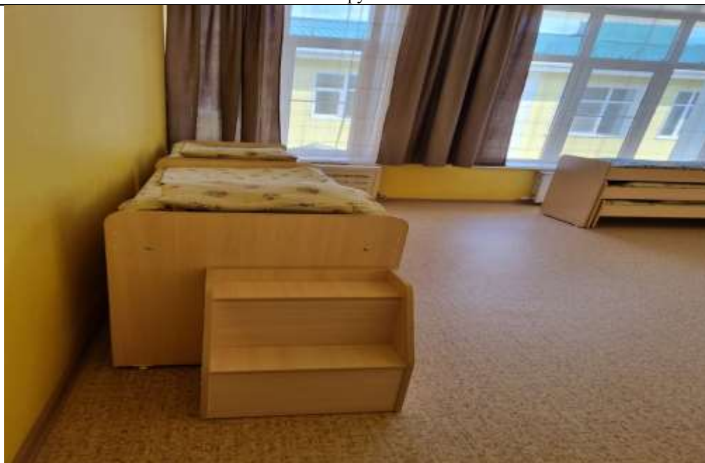
Фото 10 группа №16