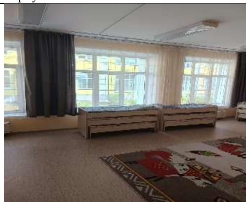
Фото группа №15 корпус 3