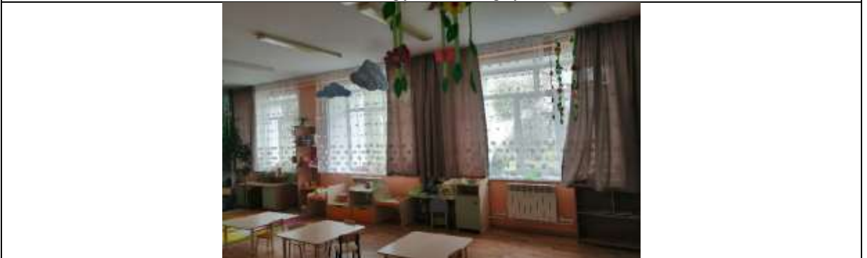
Фото 21 группа №5 корпус 2