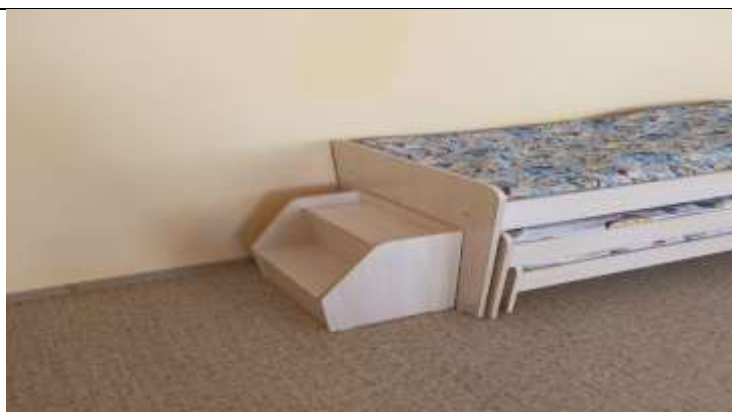
Фото 5 группа №11