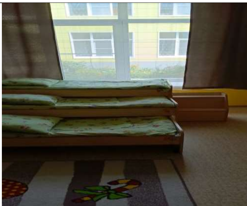
Фото 12 группа №18