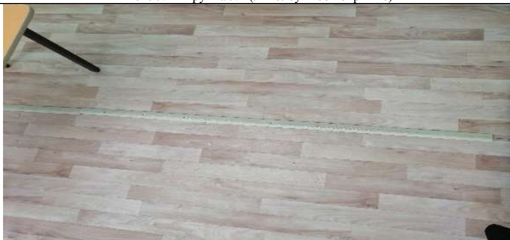
Фото №42 группа №3(линолеумное покрытие)