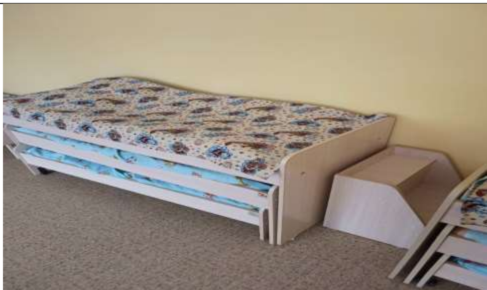
Фото 9 группа №15