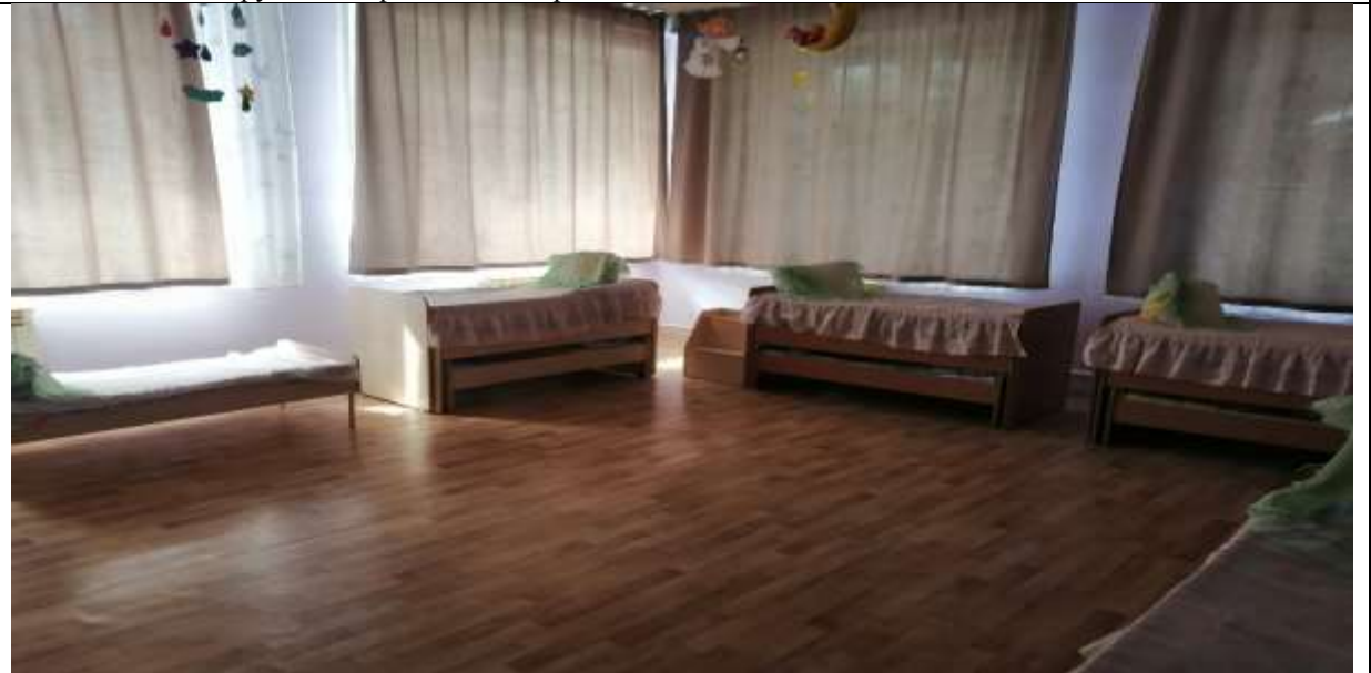
Фото 59 спальня группы №3 расстановка кроватей