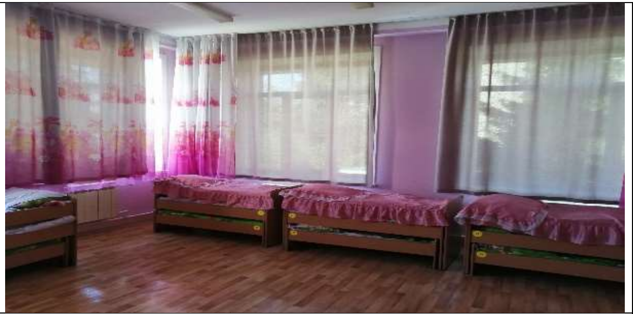
Фото 57 спальни группы №7