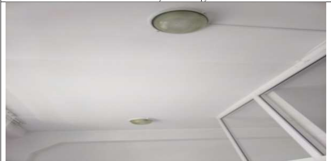
Фото 51 потолок в спальне группы №2