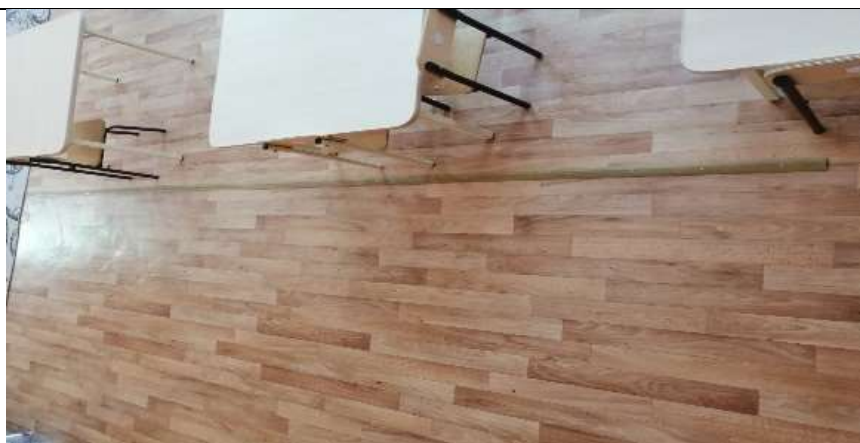
Фото №41 группа №4(линолеумное покрытие)