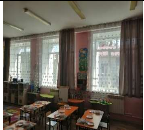
Фото 33 группа №18 корпус 3