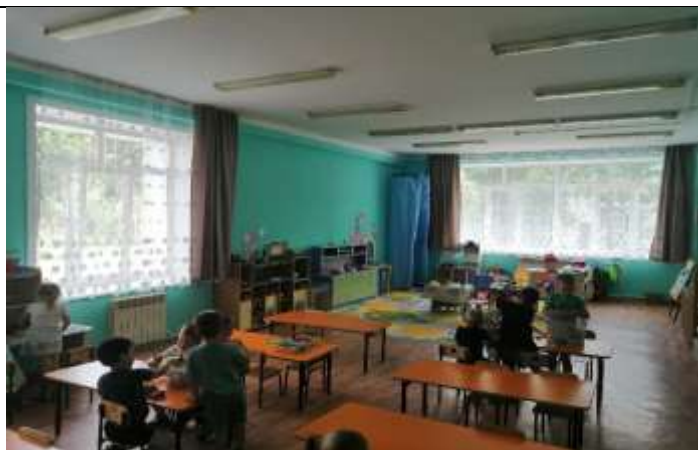
Фото 22 группа №6 корпус 2