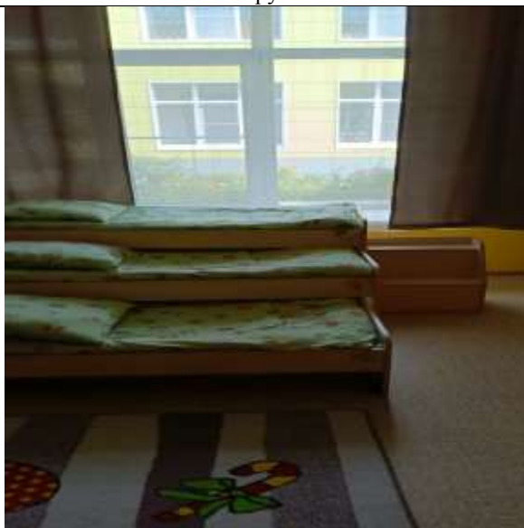
Фото 6 группа №12