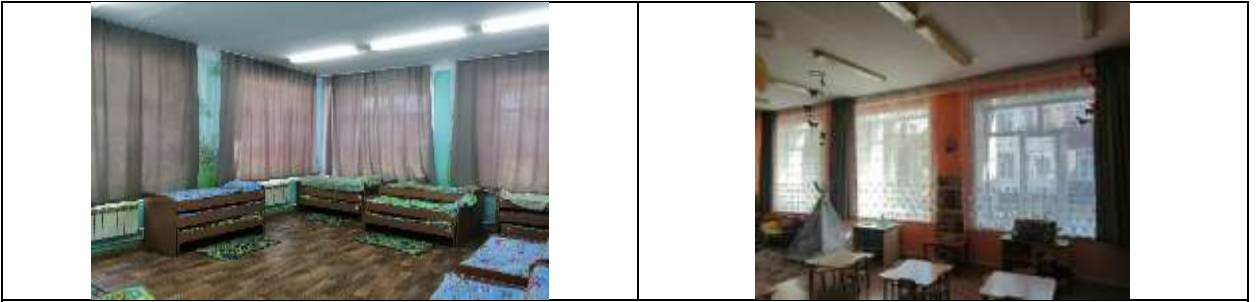
Фото 18 группа №2 корпус 2