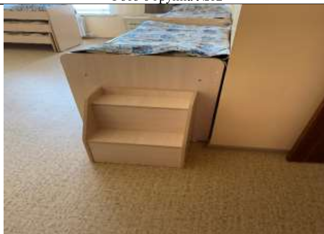
Фото 7 группа №13