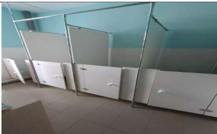
Фото 15 группа № 13