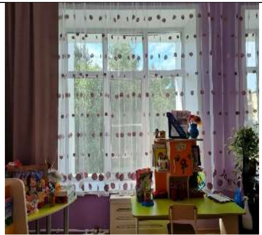
Фото 31 группа №16 корпус 3