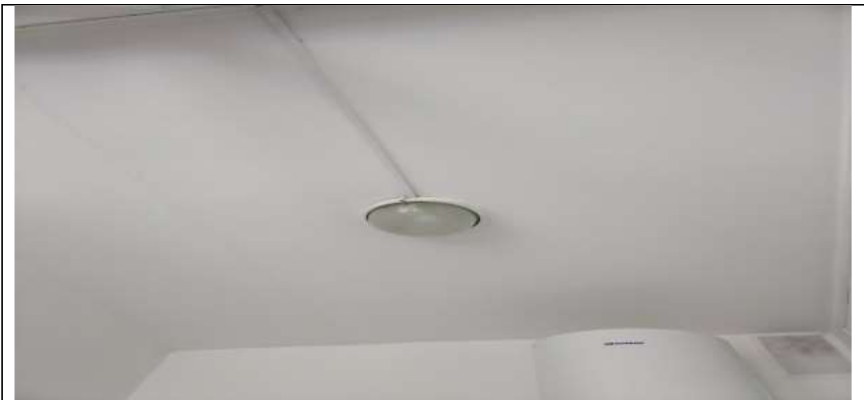
Фото 50 потолок в умывальной группы №7