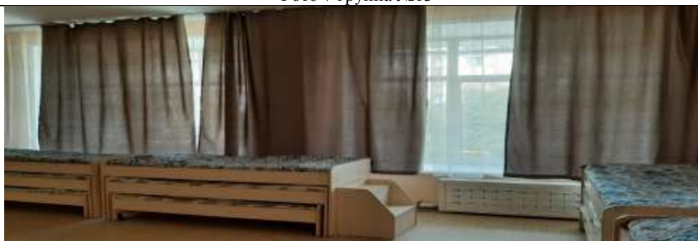
Фото 8 группа №14