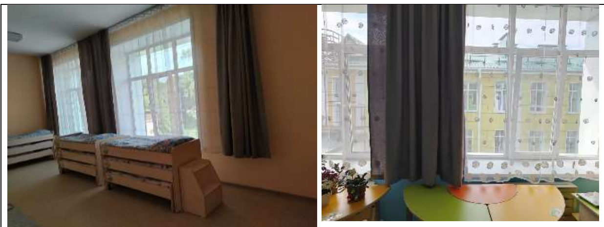
Фото 26 группа №10 корпус 3