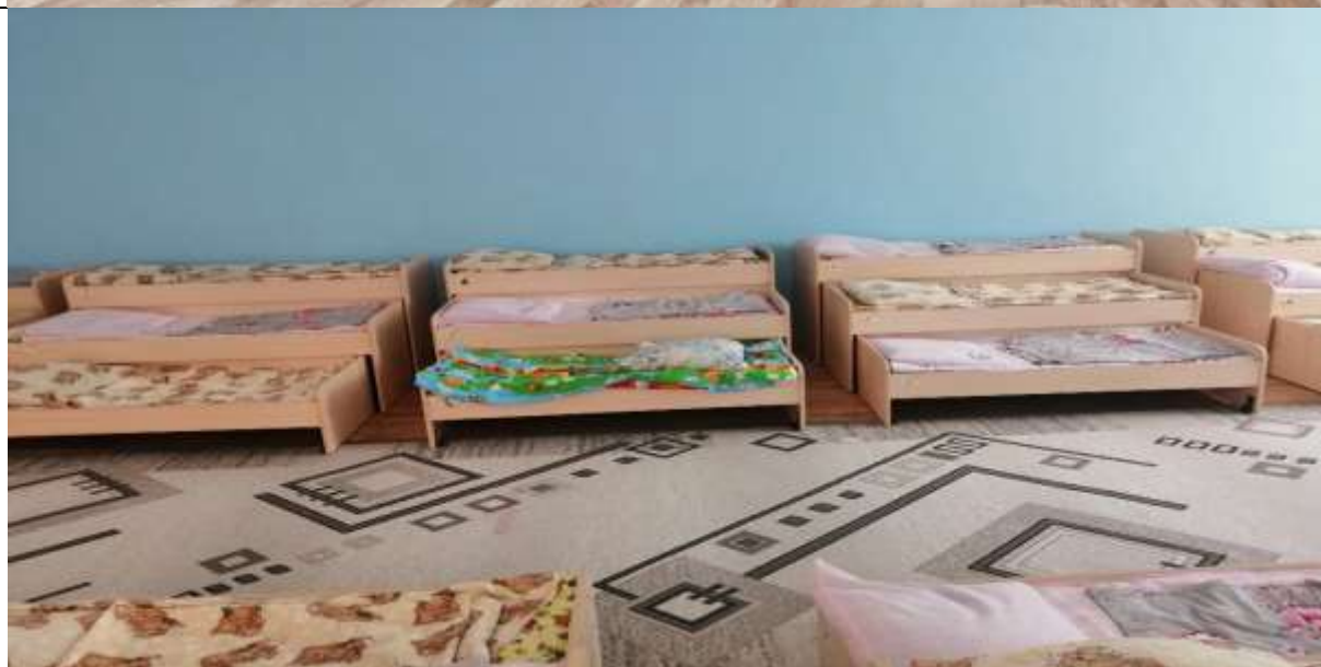
Фото 56 спальни группы №6