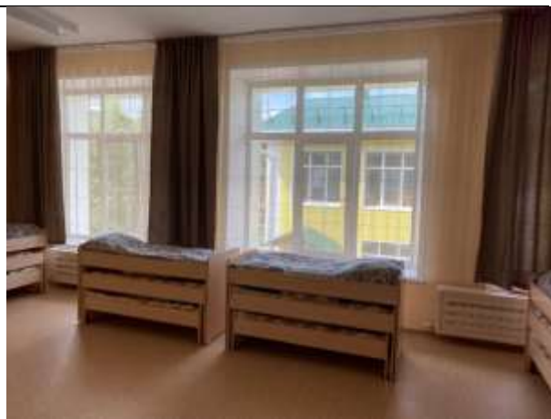
Фото 29 группа №13 корпус 3