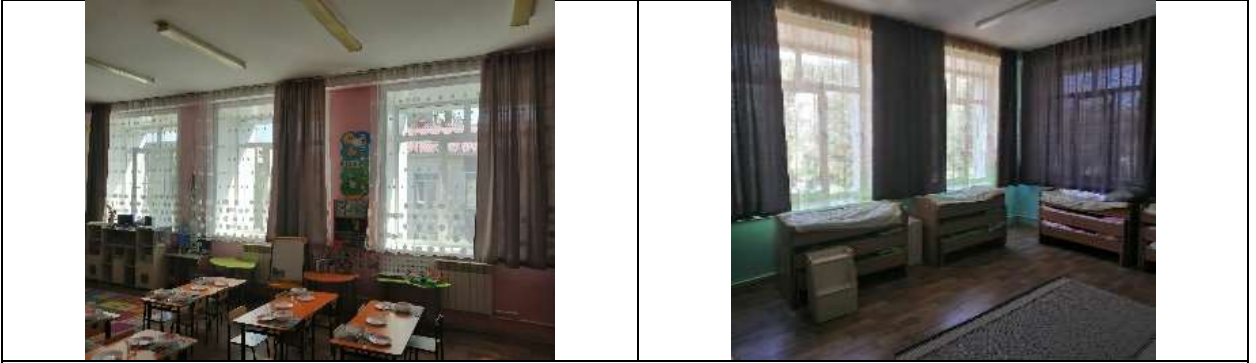
Фото 19 группа №3 корпус 2