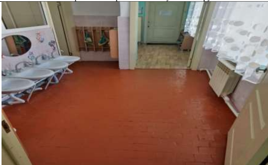
Фото 45 кафельное покрытие пола в туалетной группа №6