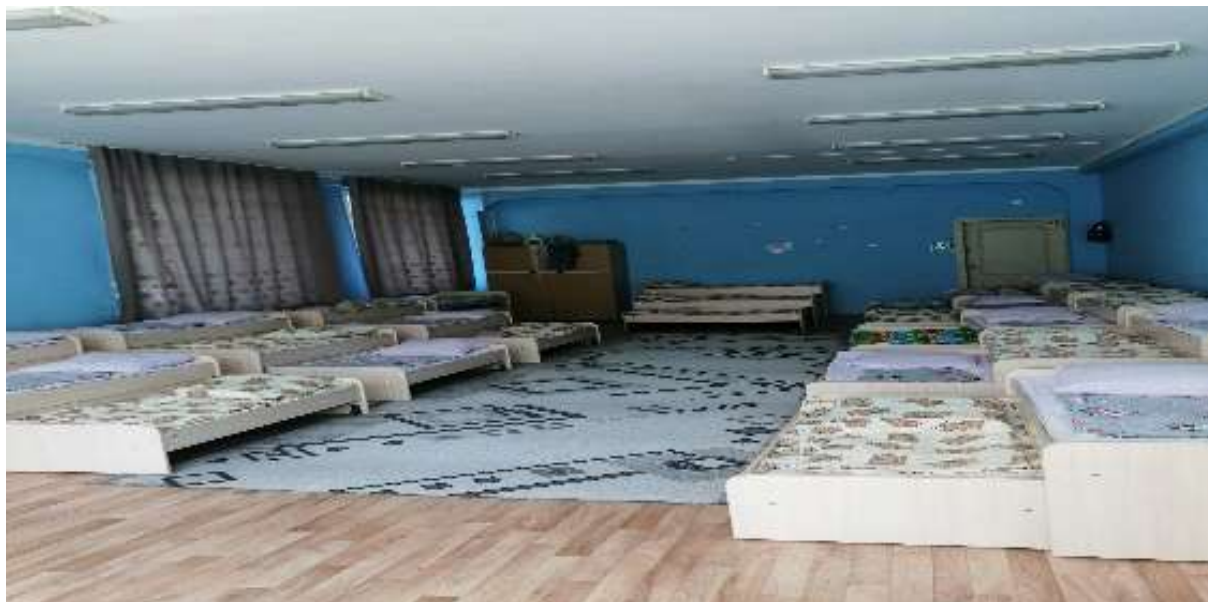
Фото 55 спальни группы №5 новые кровати , расстановка